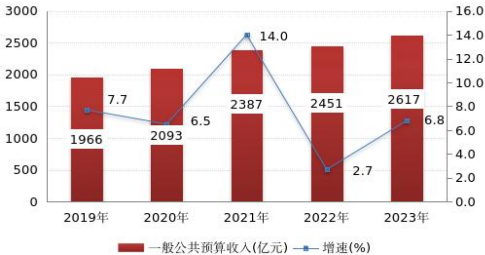
图 3 2019-2023 年一般公共预算收入及增速

全年金融业增加值 2490 亿元，比上年增长 7.7%。年末金融机构本外币存款余额 77589 亿元，增长 11.5%，其中住户存款增长 18.3%，非金融企业存款增长 10.3%。金融机构本外币贷款余额 68642 亿元，增长 9.5%。其中，企（事）业单位贷款 42244 亿元，增长 12.8%；住户贷款 26021 亿元，增长 4.3%。